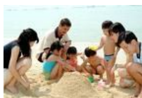
5. hace buen tiempo